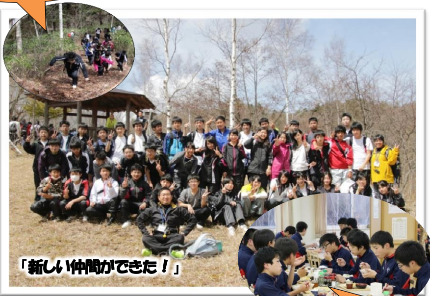
「新しい仲間ができた！」