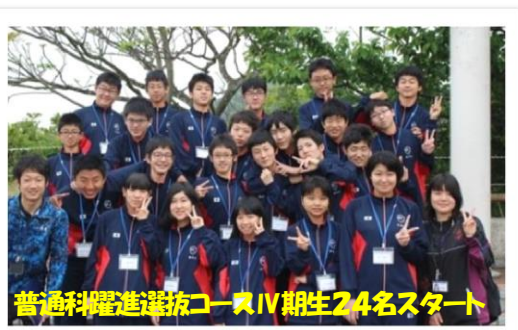
普通科躍進選抜コースIV期生24名スタート

今後はつらいことや悩むことがあると思いますが、野外合宿で学んだことを生かしていきたいと思えます。