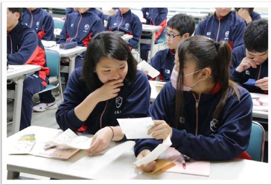
「親からの手紙に感動！」心を込めて返事を書きました。