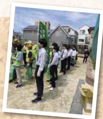
令和6年6月15日 汐路学区清掃ボランティア活動