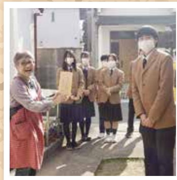
令和6年3月 子ども食堂募金