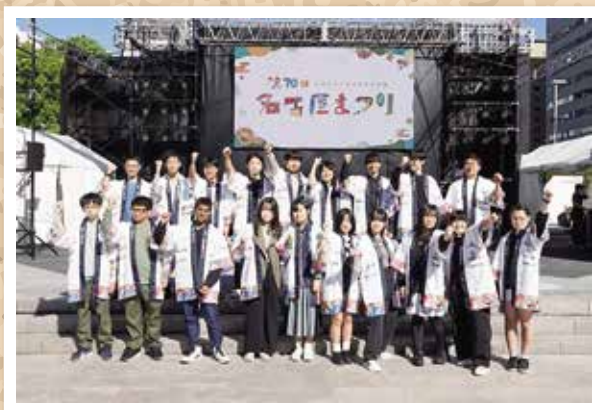
令和6年10月19-20日 名古屋まつり 学生ボランティア

毎月0の付く日に市大病院前交差点にて交通安全運動を地域の方々と実施しています。さらに汐路学区の清掃活動、子ども食堂支援募金など本校生徒が地域のために何ができるのかを考えて日々活動しています。