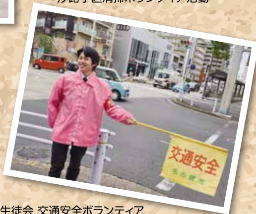
生徒会 交通安全ボランティア