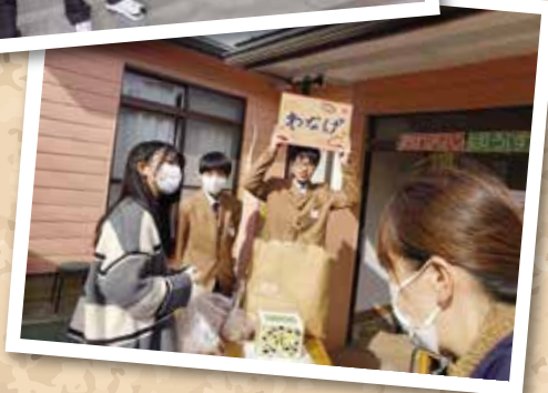
子ども食堂ボランティア活動